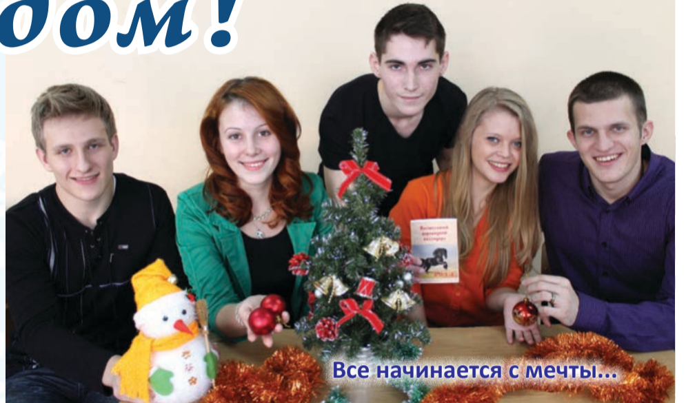
Все начинается с мечты...

Будьте здоровы, счастливы и оптимистичны! Преподавателям желаю профессионального роста, студентам