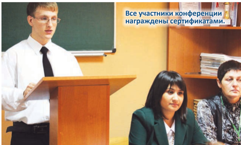
Все участники конференции награждены сертификатами.

Также на конференции присутствовали представители производств МГУП «Тираспольэнерго», ООО «Берегиня», ООО «Технология», МГУП «Бендеры-